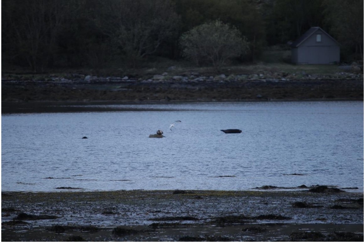
Vedlegg III Bilde VII. Rastende gråsel observert i bløtbunnsområdet 7. mai 2019.