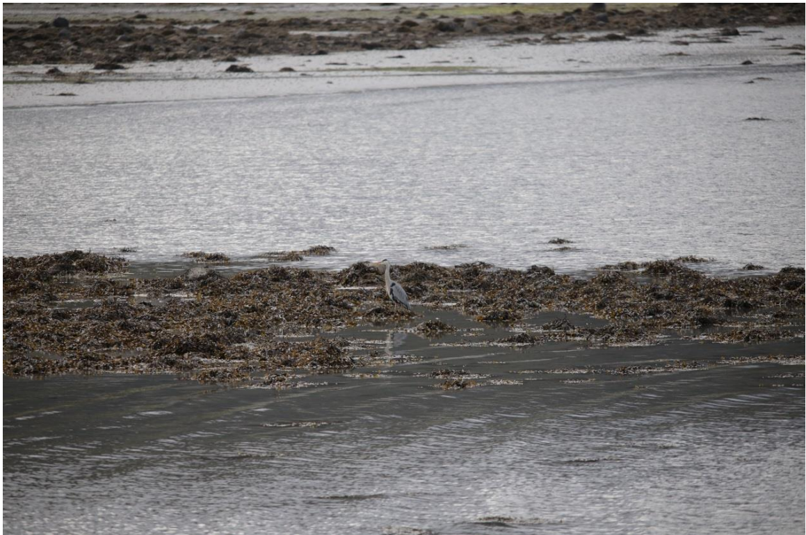
Vedlegg III Bilde VI. Gråhegre observert næringssøkende i bløtbunnsområdet 7. mai 2019.