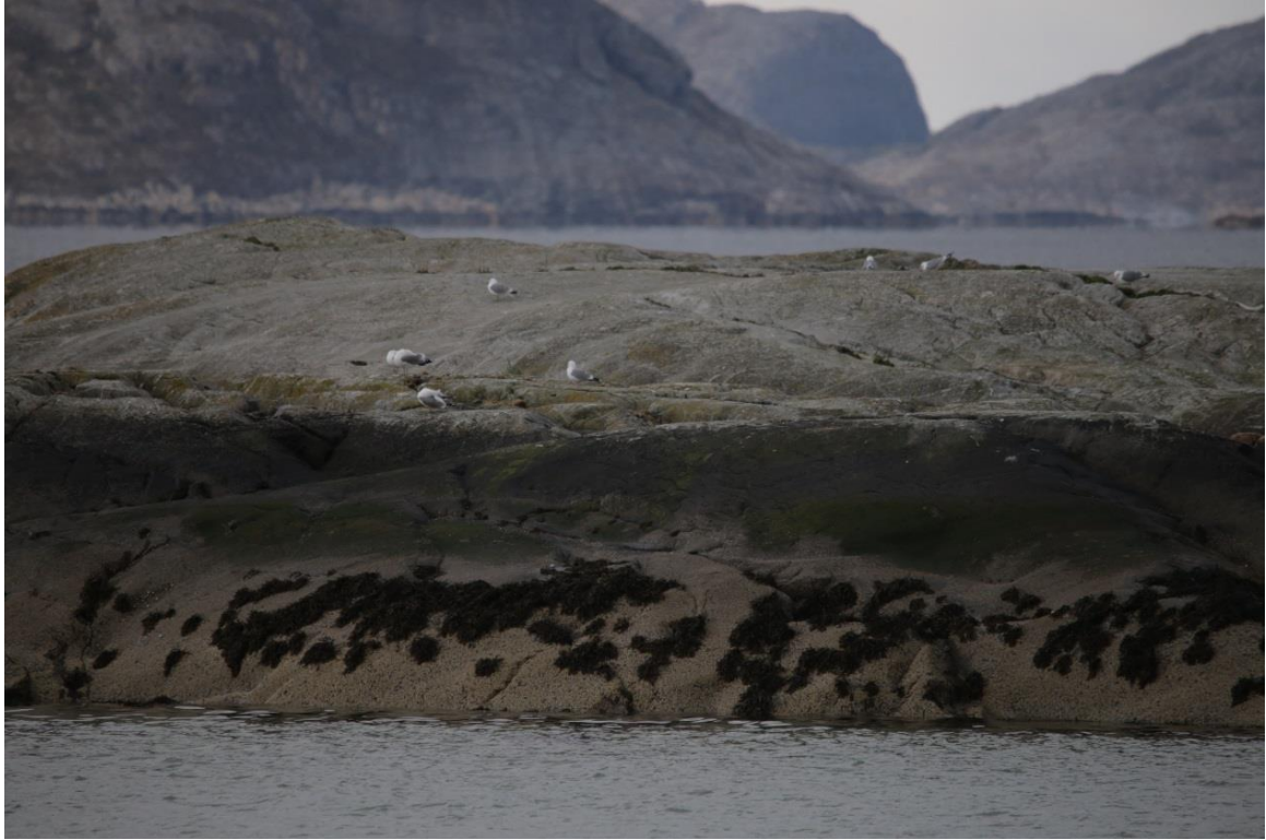
Vedlegg III Bilde III. Måkekoloni sørvest for Strand havn observert 7. mai og 11. juni 2019.