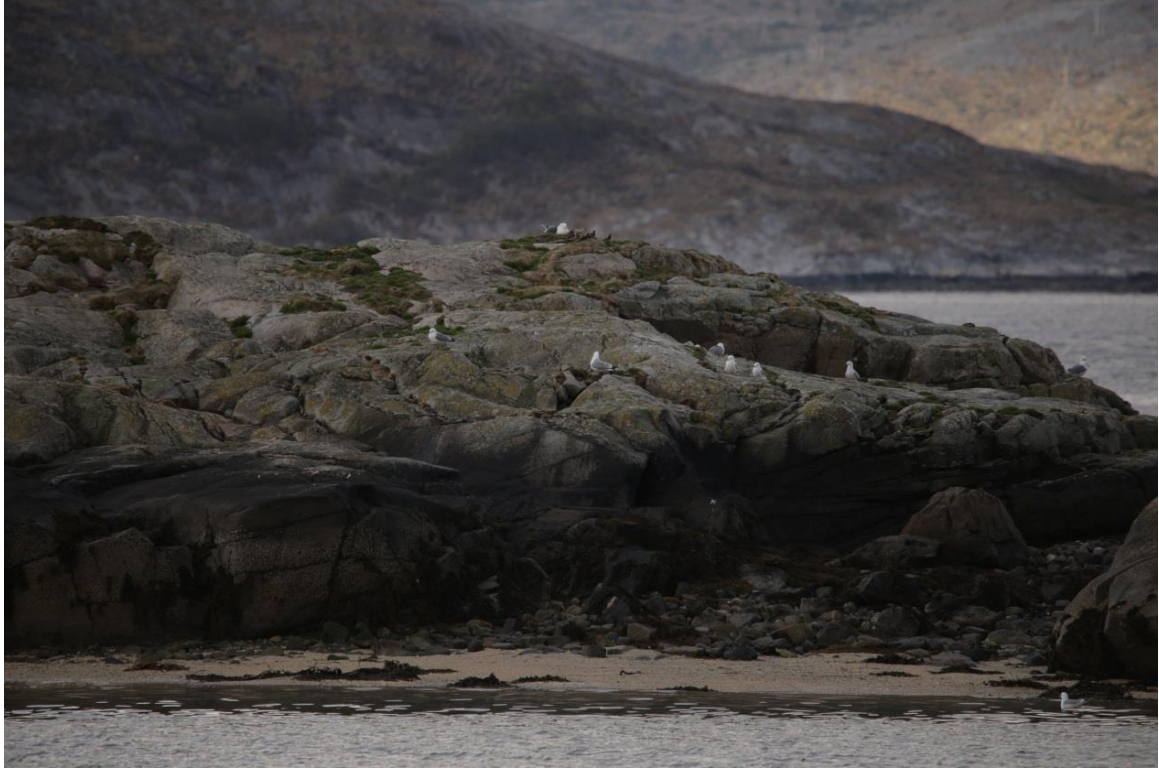
Vedlegg III Bilde V. Fiskemåke observert i måkekoloni sørvest for Strand havn 11. juni 2019.