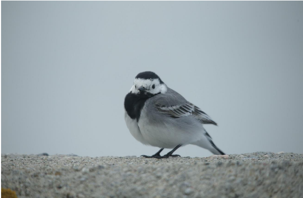
Vedlegg I Bilde II. Hekkende linerle observert 7. mai og 11. juni 2019.