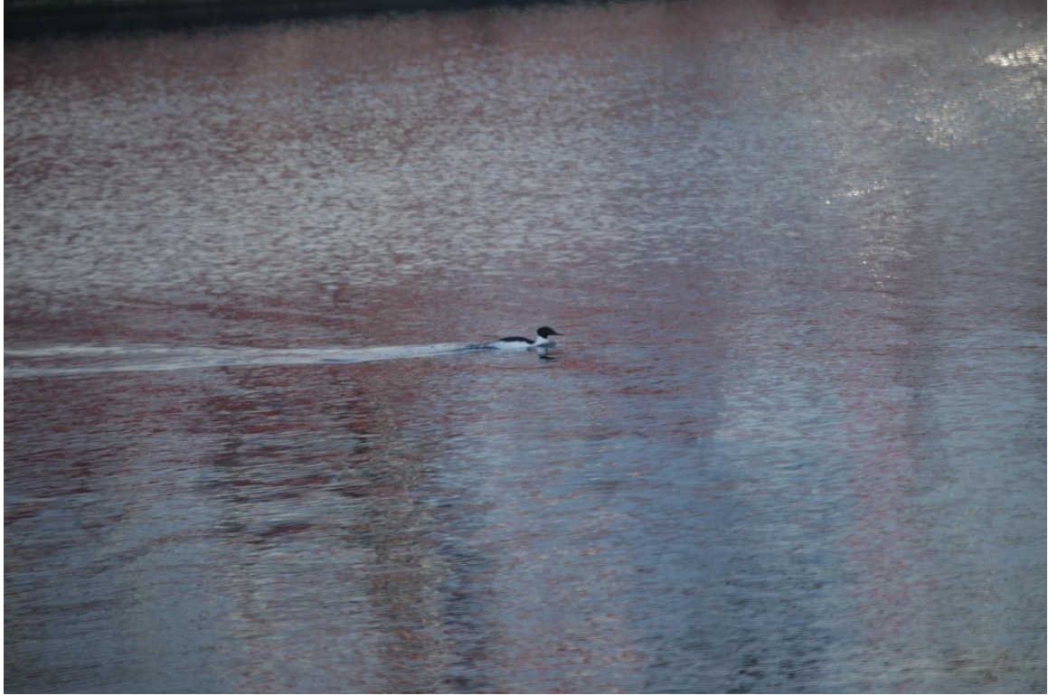
Vedlegg II Bilde II. Trekkende laksand observert næringsøkende i Strand havn 7. mai 2019.