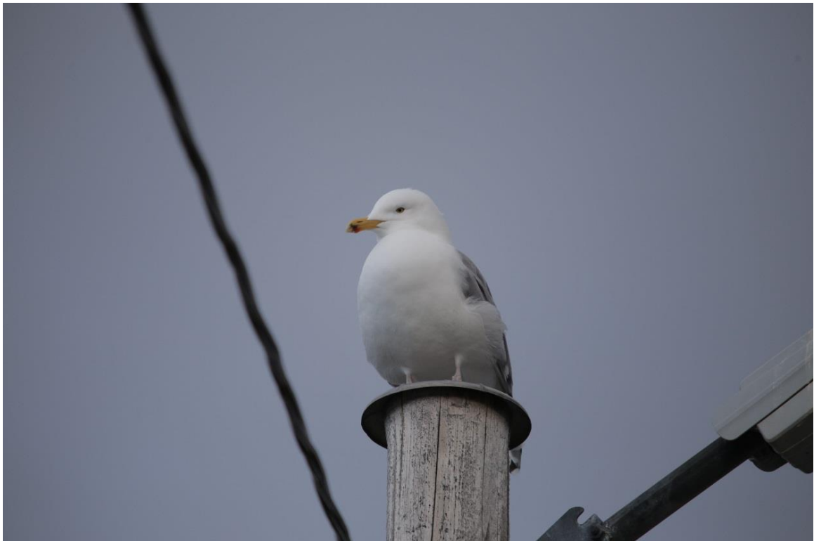
Vedlegg II Bilde III. Fiskemåke næringsøkende i Strand havn 11. juni 2019.