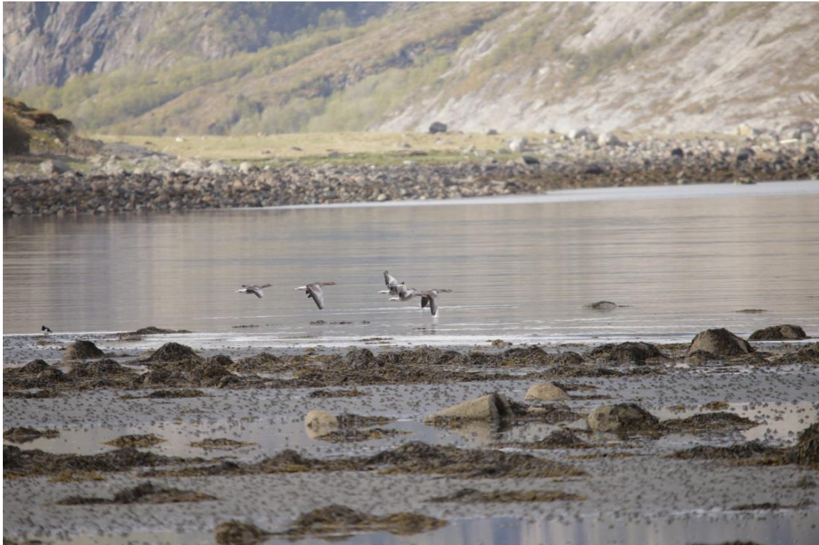
Vedlegg III Bilde I. Trekkende grågås observert næringsøkende i bløtbunnsområde 7. mai 2019.