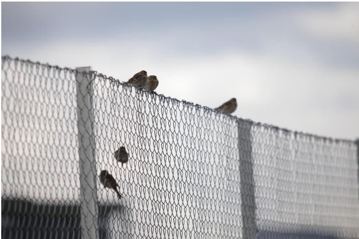
Vedlegg II Bilde I. Bergirisk observert 7. mai og 11. juni 2019 i Strand havn.