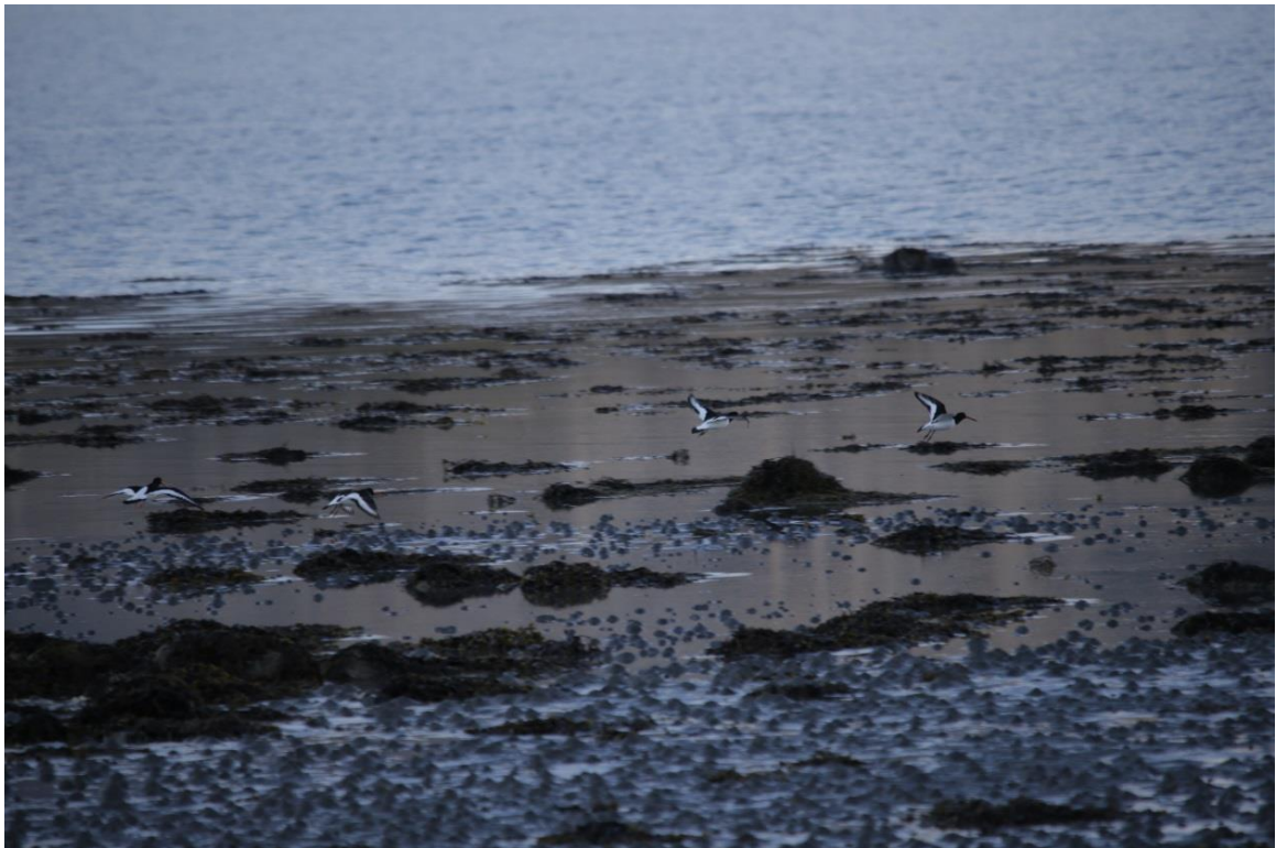
Vedlegg III Bilde IV. Næringssøkende tjeld i bløtbunnsområdet observert 5. mai 2019.