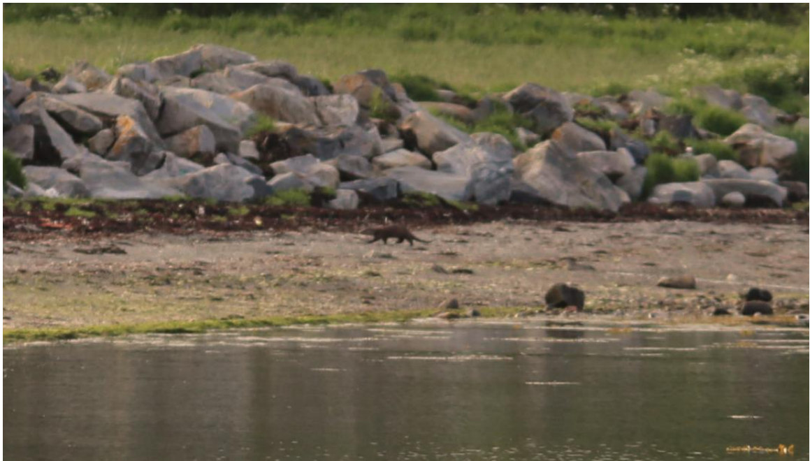
Vedlegg III Bilde VIII. Næringssøkende oter observert i bløtbunnsområdet 11. juni 2019.