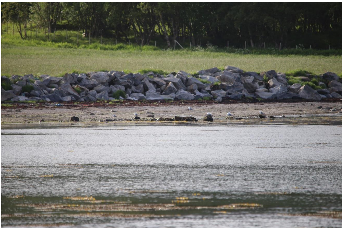
Vedlegg III Bilde II. Næringsøkende fiskemåke observert 7. mai og 11. juni 2019.